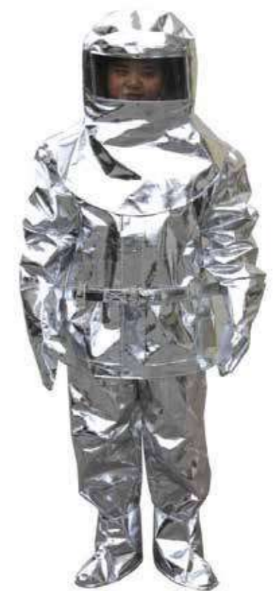
Quần áo chống cháy Fireproof clothing