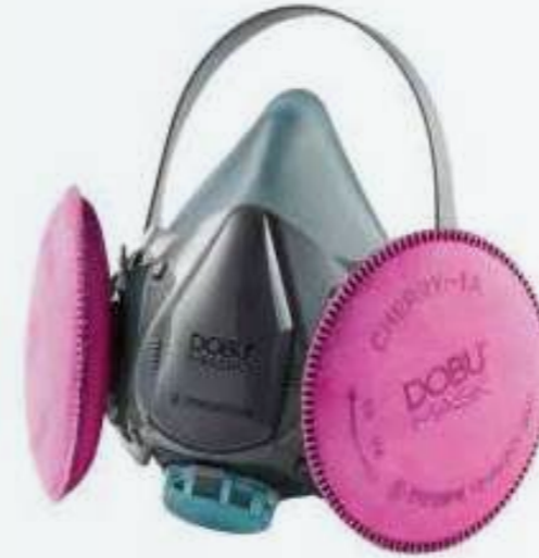
Mặt nạ lọc bụi Dust filter mask