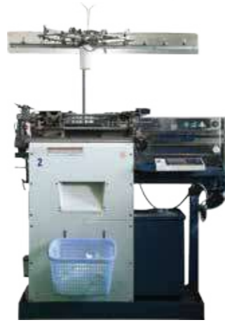
Máy 13G / 13G machine