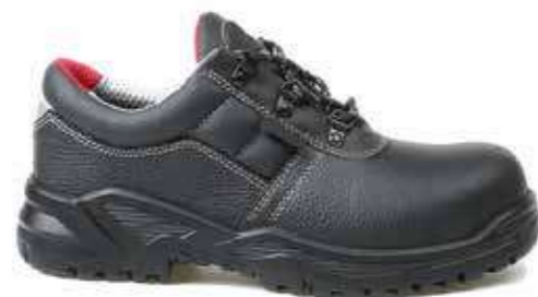
Giày chống dầu Oil-resistant shoes