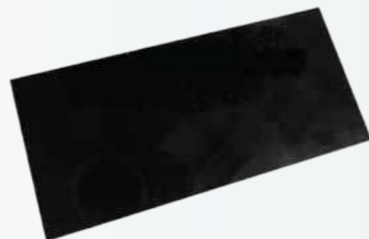
Miếng kính hàn đen Black welding glass