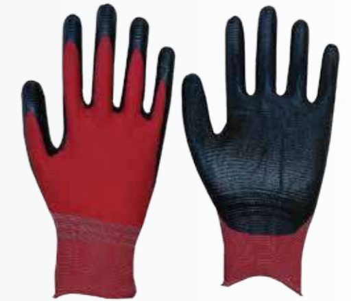
Găng tay phủ Nitrile Nitrile coated gloves