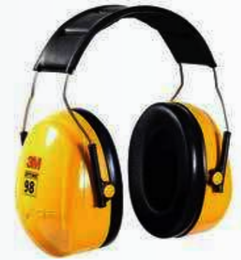
Chụp tai chống ồn Noise-cancelling earmuffs