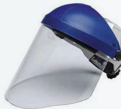
Kính chống va đập Anti-smash glass