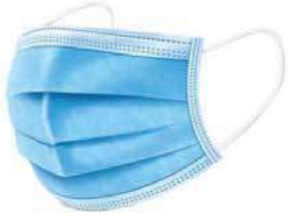
Khẩu trang y tế Medical masks