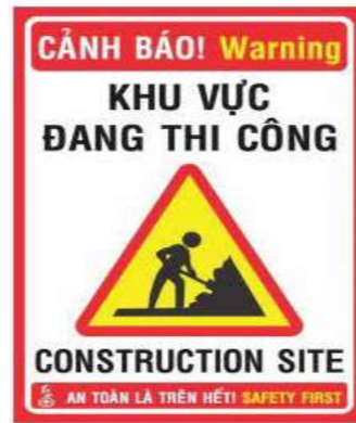
Biển báo công trường Construction Site Signs