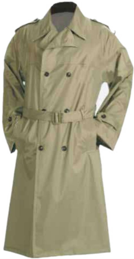
Áo mưa măng tô Mango raincoat