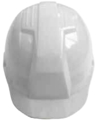
Nón LAPRO mặt vuông (ABS/HPPE) White Bullard LAPRO Helmet