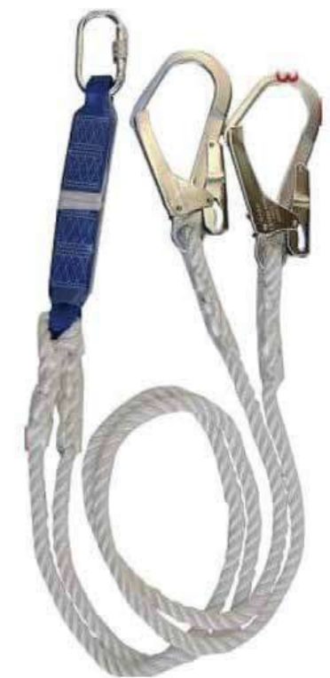
Chống sốc 2 móc Shockproof 2 hook