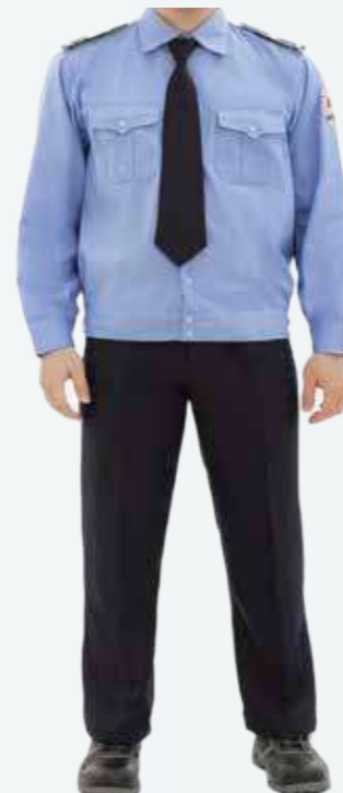
Quần áo bảo vệ Protective clothing