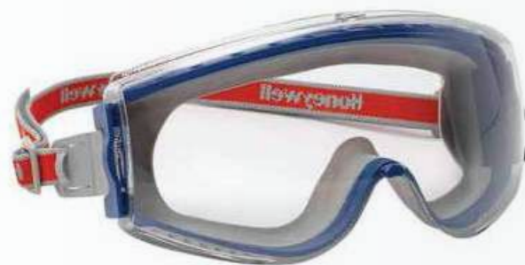
Kính chống hóa chất Chemical resistant glass