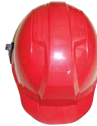
Nón LAPRO mặt vuông (ABS/HPPE) Red Bullard LAPRO Helmet