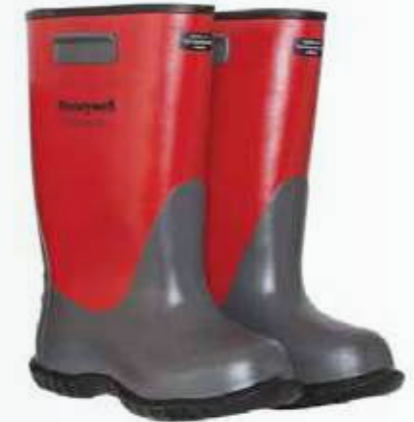
Ủng cách điện Insulated boots