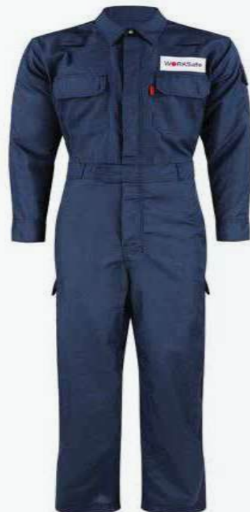
Quần áo chống nhiệt Heat-resistant clothing