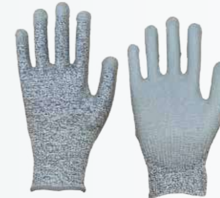
Găng tay chống cắt phủ PU Pu anti-cut gloves