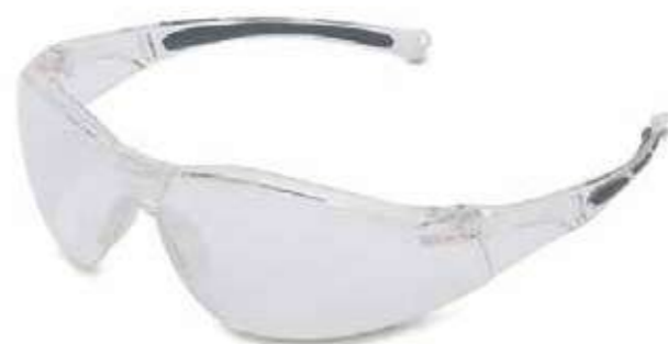
Kính chống đọng hơi sương Anti-fog glasses