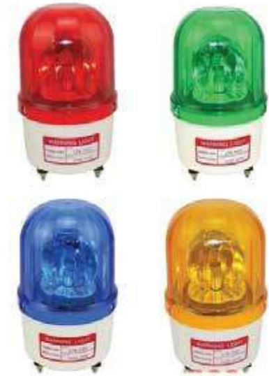
Đèn cảnh báo Signal Warning light