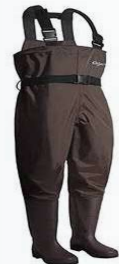
Quần liền ủng lội nước Water wading boots and overalls