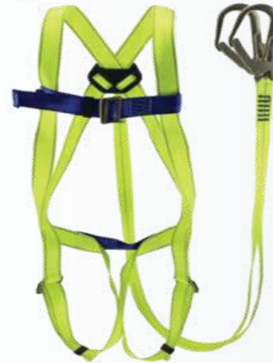
Dây đai toàn thân 2 móc Body belt 2 hook