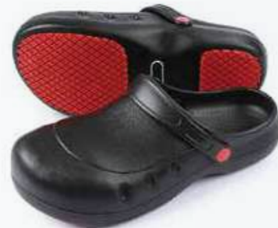
Giày chống trơn trượt Anti-slip shoes