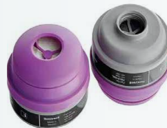
Phin lọc khí OV và bụi hơi dầu OV air filter and oil vapor dust