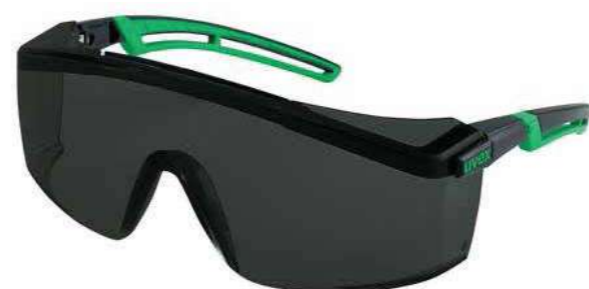
Kính hàn Solder glasses