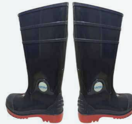
Ủng chống đâm xuyên và dập ngón Anti-piercing and puncture-resistant boots