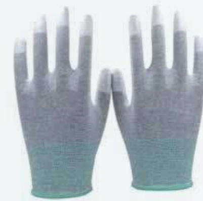
Găng tay chống tĩnh điện Antistatiques gloves