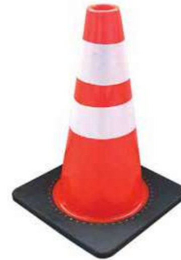
Cọc tiêu Traffic cone