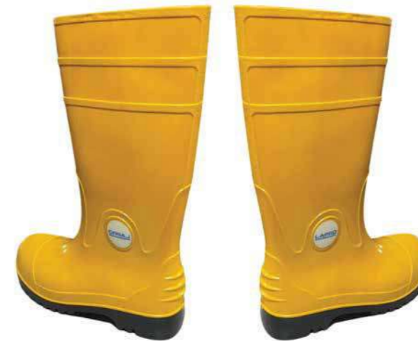
Ủng cao su đi mưa Rubber rain boots