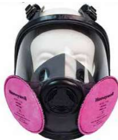
Mặt nạ phòng độc nguyên mặt Full face respirator mask