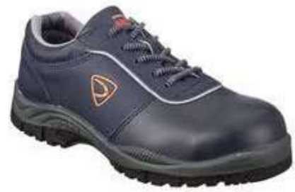
Giày cách điện Insulated shoes