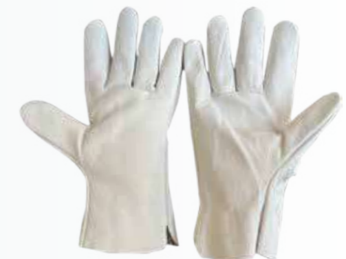
Găng tay da hàn Welding leather gloves