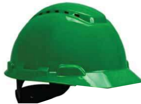
Nón LAPRO lỗ thông khí (ABS/HPPE) Ventilated LAPRO Helmet