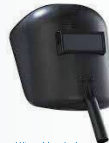
Mặt nạ hàn cán ép Pressed solder mask