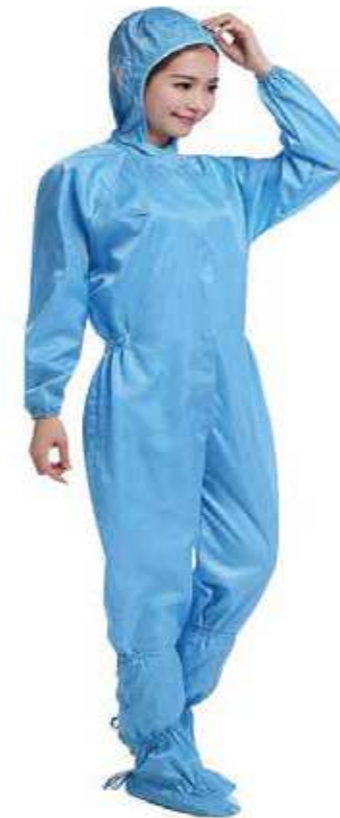
Quần áo chống tĩnh điện Anti-static clothing