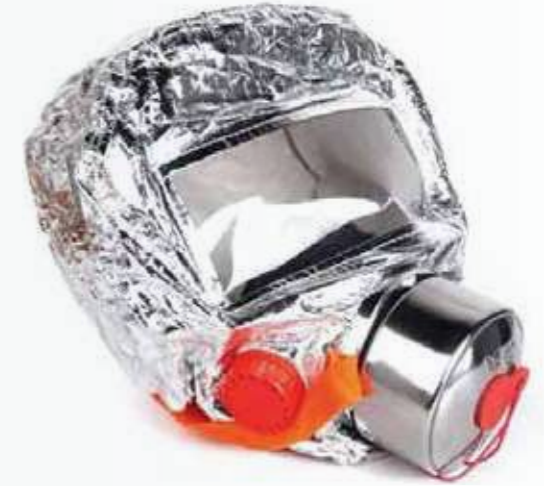
Mặt nạ chống khói PCCC Fire protection mask