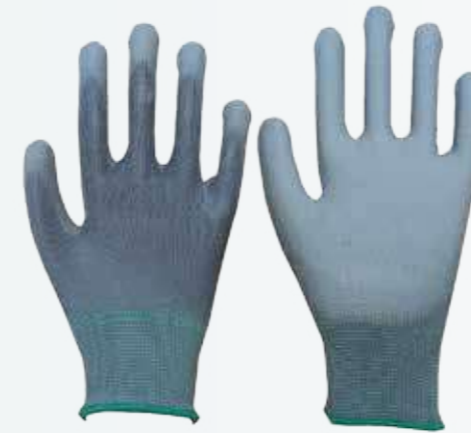
Găng tay phủ PU PU crinkle gloves