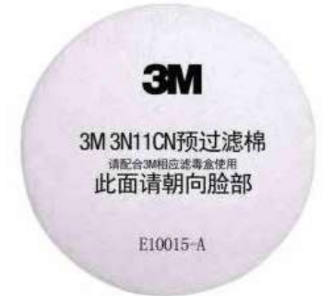
Tấm lọc bụi Dust filter