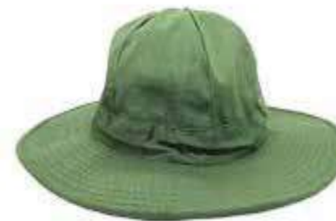
Nón tai bèo Camouflage hat