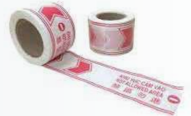
Cuộn rào cảnh báo Warning fence roll