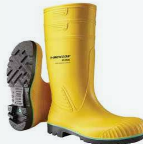
Ủng chống hóa chất Chemical resistant boots