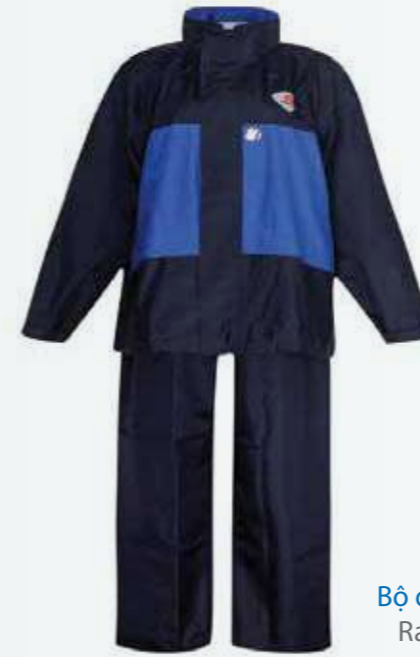
Bộ quần áo mưa Raincoat suit