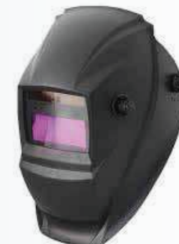
Mặt nạ hàn điện tử Electronic mask