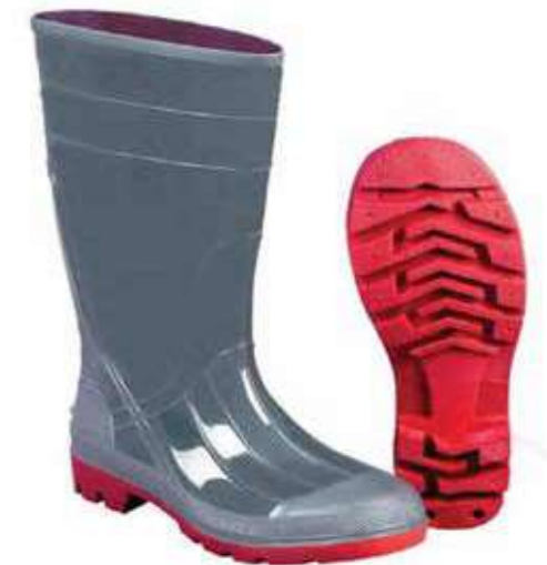
Ủng chữa cháy Fire boots