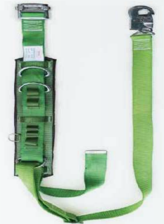
Dây đai hông Hip belt