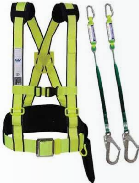
Dây đai bán thân 1 móc Bust belt with 1 hook