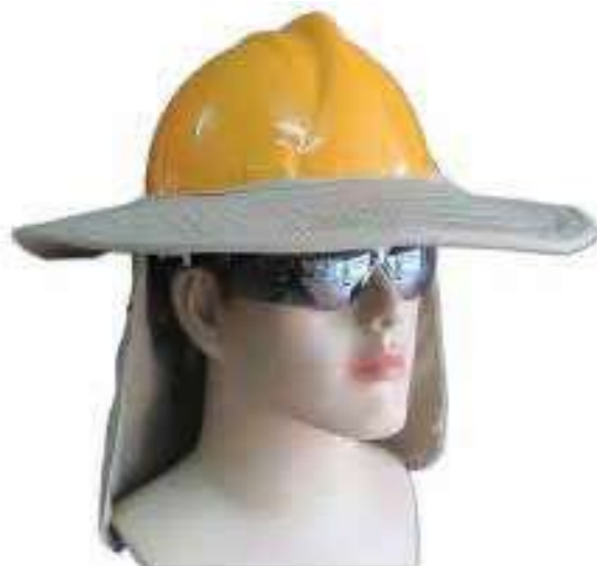
Vành mũ che nắng LAPRO Sun hat brim