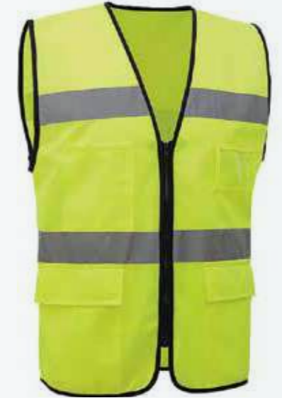
Áo phản quang Reflective clothing