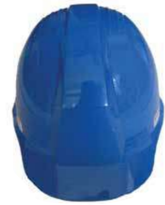
Nón LAPRO mặt vuông (ABS/HPPE) Blue Bullard LAPRO Helmet