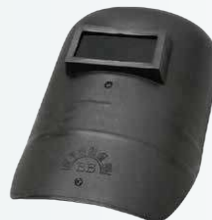
Mặt nạ hàn cầm tay trong Inner hand-held solder mask