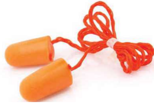
Nút tai chống ồn Noise earplugs