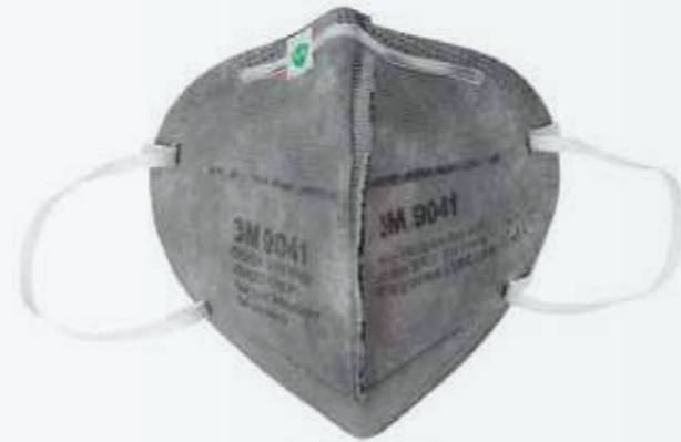
Khẩu trang chống hóa chất Chemical resistant masks