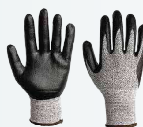
Găng tay chống cắt phủ Nitrile Nitrile anti-cut gloves