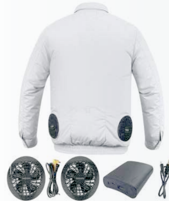
Áo quạt gió Windbreaker