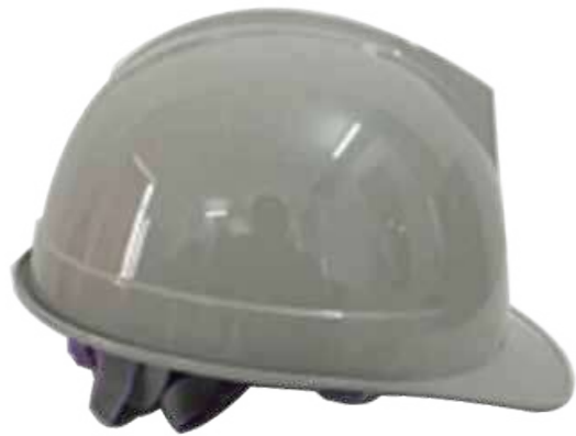
Nón LAPRO mặt tròn (ABS/HPPE) Round face LAPRO Helmet