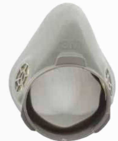
Chụp mũi Nose cap