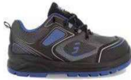
Giày chống tĩnh điện Anti-static shoes