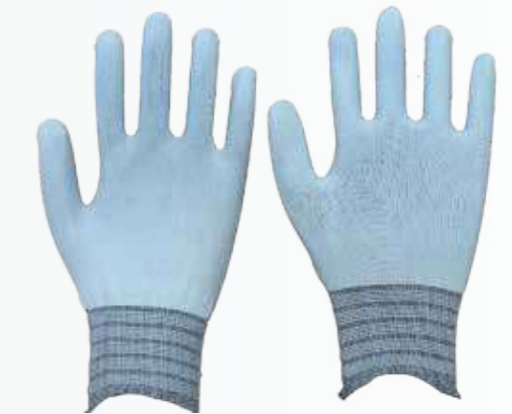
Găng tay nylon Nylon gloves