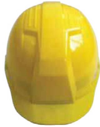
Nón LAPRO mặt vuông (ABS/HPPE) Yellow Bullard LAPRO Helmet