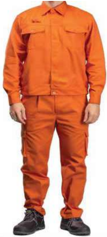
Quần áo ngành điện Electrical industry clothing