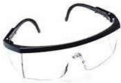
Kính chống bụi Dustproof glass