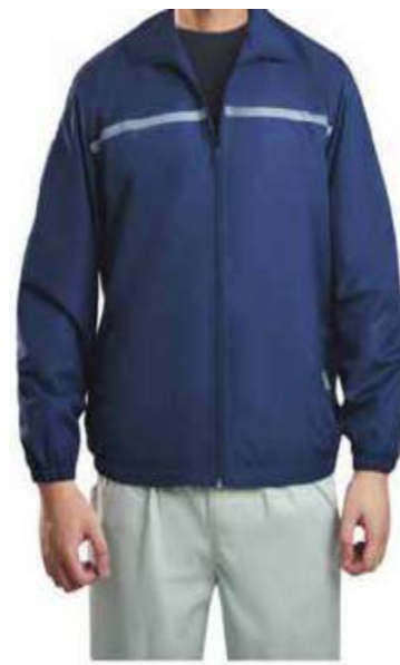
Áo khoác công nhân Worker jacket