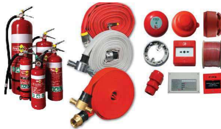
Thiết bị phòng cháy chữa cháy Fire safety products