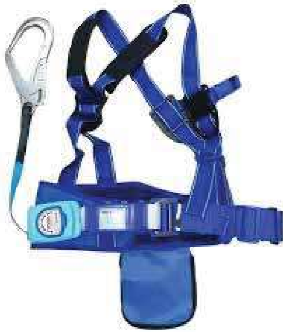
Dây đai bán thân có nút bấm tự động The bust strap has automatic buttons