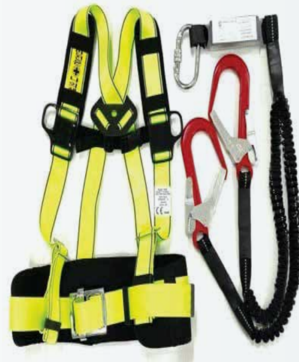
Dây đai bán thân 2 móc Bust belt with 2 hook