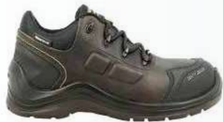
Giày chống nước Waterproof shoes