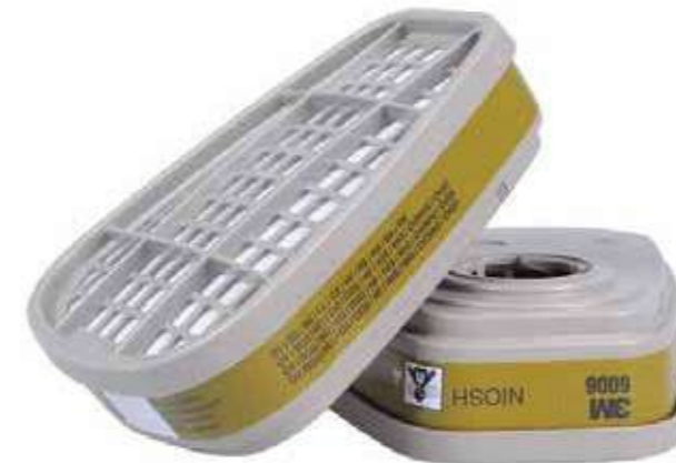
Phin lọc độc Toxic filter