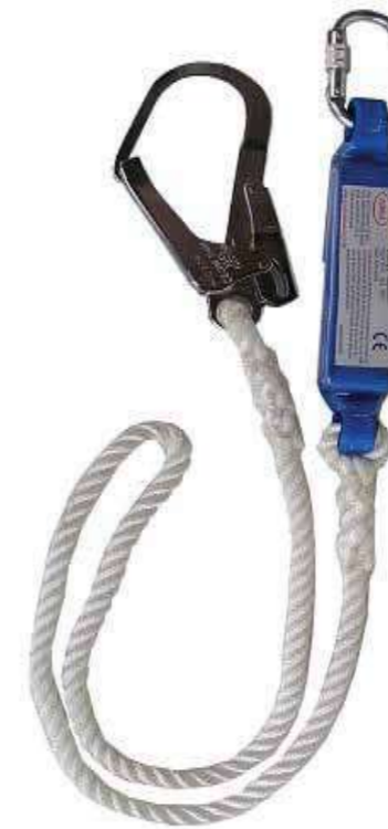
Chống sốc 1 móc Shockproof 1 hook