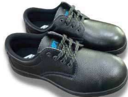
Giày chống đâm xuyên và dập ngón Puncture- and toe-resistant shoes