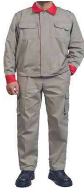
Quần áo công nhân Work clothes