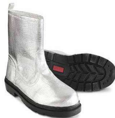
Giày chịu nhiệt Heat-resistant shoes