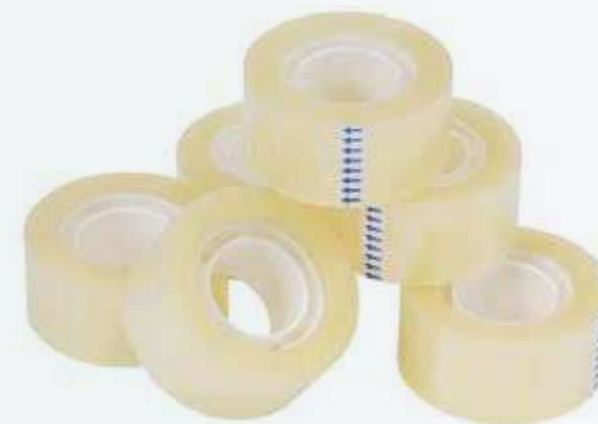
Băng keo Tape