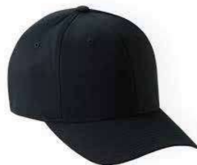
Nón kết Cap