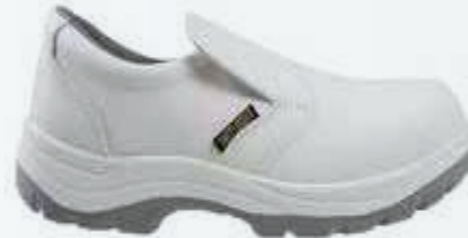
Giày phòng sạch Cleanroom shoes