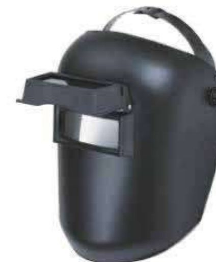
Mặt nạ hàn đội đầu Welding head mask