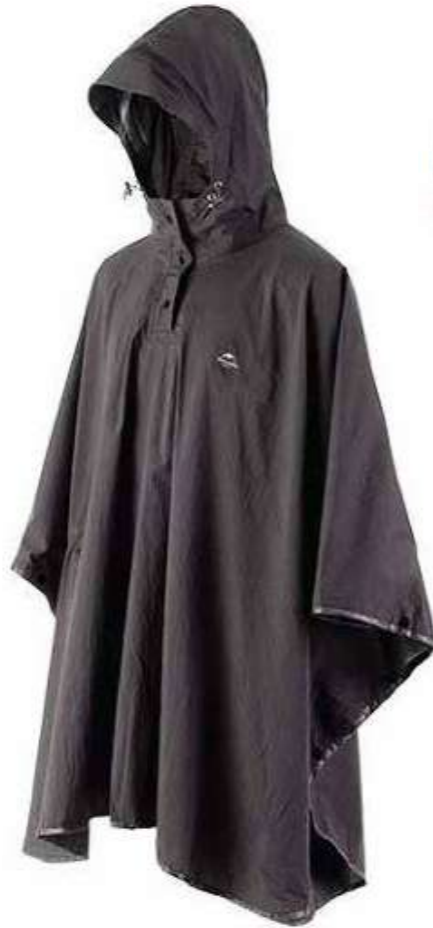
Áo mưa cánh dơi Bat-wing raincoat