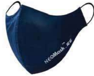
Khẩu trang than hoạt tính Activated carbon gauze mask