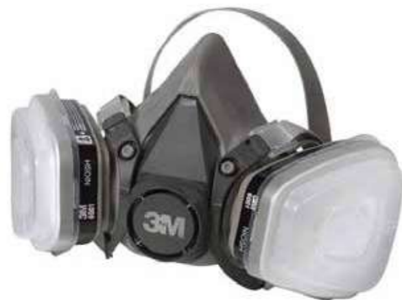
Mặt nạ phòng độc 2 phin Respirator mask 2