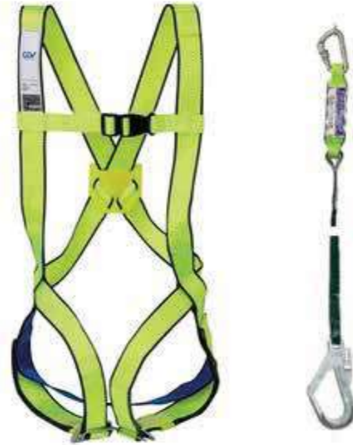
Dây đai toàn thân 1 móc Body belt 1 hook