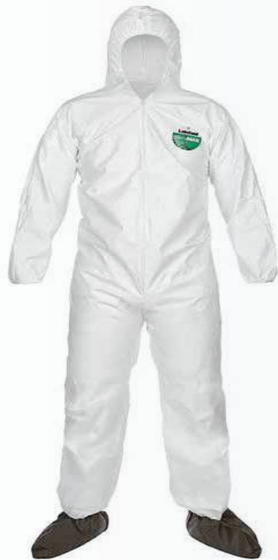
Quần áo chống hóa chất Chemical resistant clothing