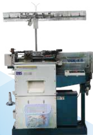
Máy 10G / 10G machine

Facilities: 1,100 machines Capacity: 290,000 pairs/day