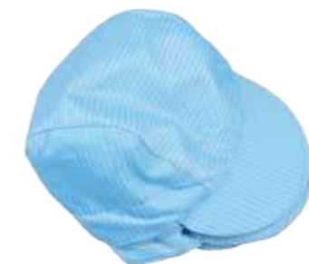
Nón phòng sạch Cleanroom hat