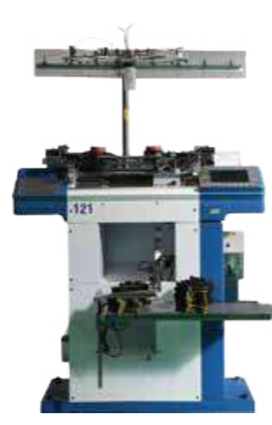
Máy 15G / 15G machine