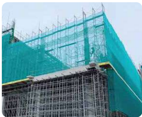
Lưới công trình Plastic grid for construction