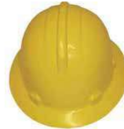
Nón LAPRO vành rộng (ABS/HPPE) Full Brim LAPRO Helmet