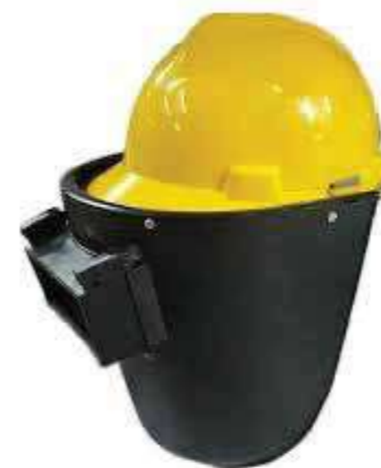
Mặt nạ hàn gắn trên mũ Welding mask on the hat