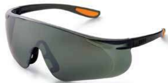
Kính chống tia laser Anti-laser glasses