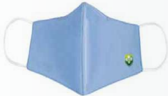
Khẩu trang vải chống bụi Anti-dust cloth mask