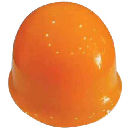
Nón LAPRO tròn trơn (ABS/HPPE) Round LAPRO Helmet